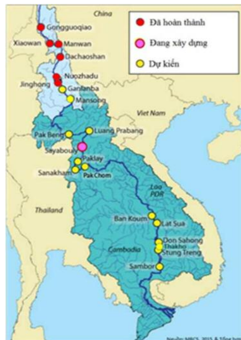
Hình 1. Hồ đập thủy điện trên dòng chính Mê Công năm 2017

1 Đài Khí tượng Thủy văn khu vực Nam Bộ Email: dungdubao@gmail.com